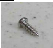
付属のタッピングネジ